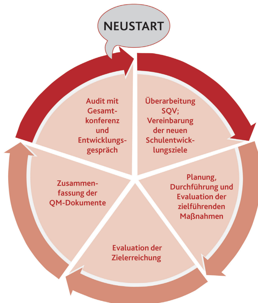
Abb. 1: Qualitätszyklus der eigenverantwortlich arbeitenden berufsbildenden Schulen 1

In diesem Sinne markiert der in diesem Handbuch dargestellte Zielvereinbarungsprozess den Abschluss (Audit mit Gesamtkonferenz und Entwicklungsgespräch) sowie Neustart (Überarbeitung des Schulspezifischen Qualitätsverständnisses ‚SQV‘ und Vereinbarung der neuen Schulentwicklungsziele) des Qualitätszyklus einer eigenverantwortlich arbeitenden berufsbildenden Schule in Rheinland-Pfalz: