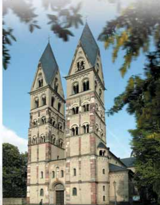
La Basilique Saint-Castor

(1307-1354) et par la création de circonscriptions juridiques et administratives. Les églises et les communautés religieuses font partie intégrante de toute ville moyenâgeuse. La célébration commune des offices et les fêtes religieuses règlent le quotidien des habitants. En outre, les institutions religieuses prenaient en charge les importantes œuvres sociales et caritatives. L'église Notre-Dame était le centre de l'assistance spirituelle prodiguée par les prêtres. Au Moyen-âge, les deux sites spirituels les plus importants de Coblenche étaient la basilique Saint-Castor et l'église Saint-Florin. Ces lieux de culte bénéficiaient du soutien des archevêques de Trèves et de la noblesse de la région. Kuno de Falkenstein (1361-1388) fut le premier archevêque de Trèves inhumé à Coblenche, ce qui montre bien que Coblenche confirmait son accession au rang de résidence épiscopale. L'établissement d'un canonicat dans l'un des deux chapitres est une étape importante dans l'accession aux grands honneurs cléricaux. Parmi les dignitaires, on trouve non seulement quelques archevêques de Trèves, mais aussi le célèbre théologien et réformateur du clergé, le Cardinal Nicolas Cusanus (1401-1464). La présence de nombreuses communautés