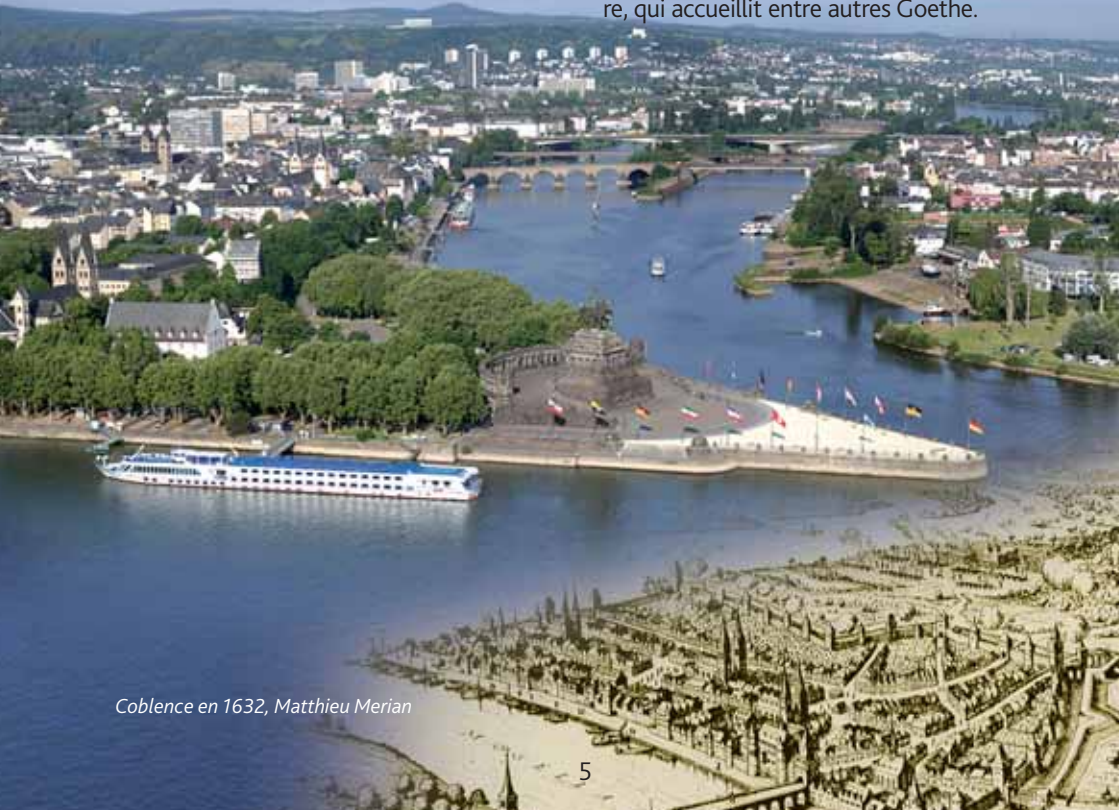
Coblence en 1632, Matthieu Merian

Le 18ème siècle connut un nouvel essor des activités de construction : le prince électeur François-Georges, de la famille von Schönborn passionnée d'architecture, fit construire un pavillon de chasse selon des plans de Balthasar Neumann et agrandir la résidence. Mais ce projet n'était pas encore à la mesure des ambitions représentatives et administratives du dernier prince électeur de Trèves. Clément Wenceslas de Saxe décida de transférer la résidence d'Ehrenbreitstein vers Coblence. Les fortifications urbaines au sud de la ville durent être abattues pour construire le nouveau château de résidence sur la rive du Rhin. Grâce à ce projet, de nouveaux espaces furent créés non seulement pour le château, mais aussi pour l'élargissement de la ville avec les nouveaux quartiers. C'est le chancelier de La Roche qui présidait la commission chargée des travaux, son épouse Sophie (1730-1807) est considérée comme la fondatrice du roman féminin allemand et tenait un salon littéraire, qui accueillit entre autres Goethe.