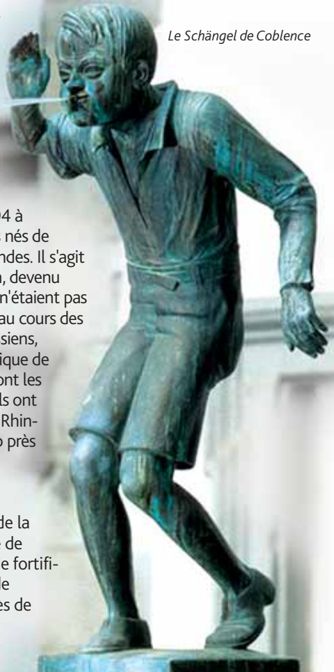
Le Schängel de Coblence

Les premières traces d'une colonisation durable de la région de Coblence remontent au milieu de l'âge de pierre. A l'époque celte, d'importants systèmes de fortifications firent leur apparition dans le Stadtwald de Coblence et sur l'Ehrenbreitstein. Le Goloring près de