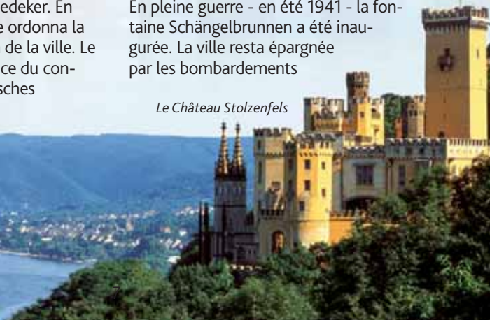
Le Château Stolzenfels

Avec l'invasion de la zone démilitarisée par la Deutsche Wehrmacht en 1936, Coblenz redevint ville de garnison. La majeure partie de la population fit preuve d'une opposition aussi molle qu'en 1933, lorsque les Nazis prirent le pouvoir dans la ville. En 1934, une "Place du conseil" fut construite devant le château de la capitale régionale, pouvant recevoir plus de 100.000 personnes. Par contre, les habitants juifs n'étaient plus souhaités à Coblenz. Rien qu'entre 1942 et 1945, 888 personnes de la ville et des environs de Coblenz ont été déportées dans des camps de concentration. En pleine guerre - en été 1941 - la fontaine Schängelbrunnen a été inaugurée. La ville resta épargnée par les bombardements