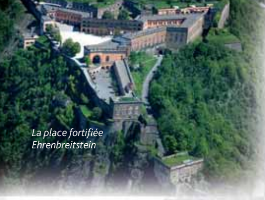
La place fortifiée Ehrenbreitstein

intensifs des Alliés jusqu'en avril 1944. En une seule année, la ville a ensuite été détruite à 87 pourcent. La vieille ville historique disparut à tout jamais. En mars 1945, les troupes américaines occupèrent la ville.