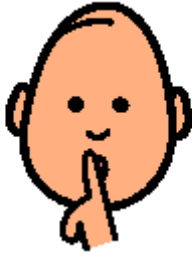
wir sind leise

Beispiel 6: Regelkarten für einen Schüler mit Frühkindlichem Autismus, 1. Schulbesuchsjahr einer Schule mit dem Förderschwerpunkt Ganzheitliche Entwicklung. Der nichtsprechende Schüler zeigte problematische Verhaltensweisen wie Material vom Tisch fegen, schreien und aufspringen.