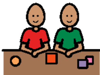
das Material bleibt liegen