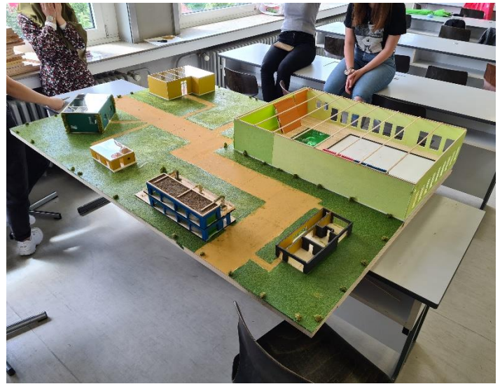
Modellbauprojekt „Schüler bauen eine Schule“