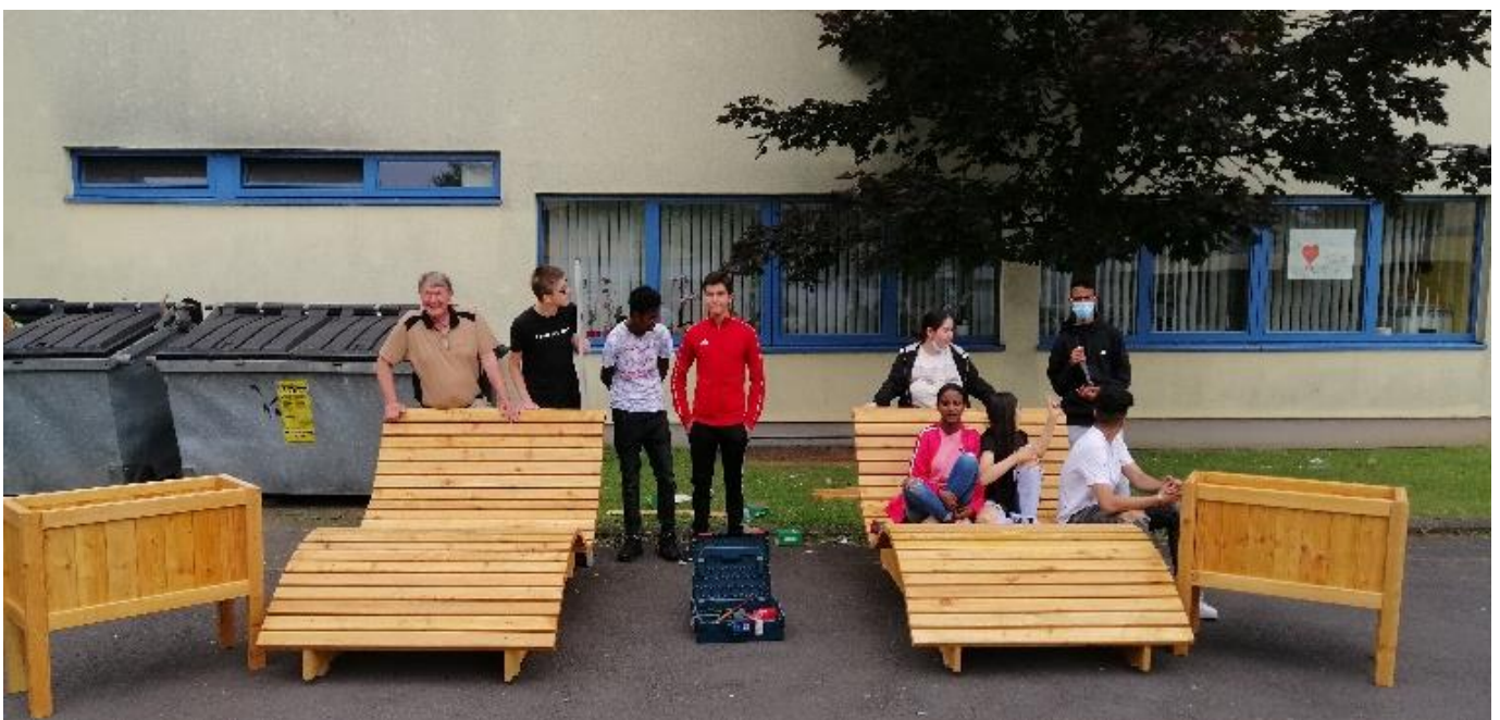
Relaxliegen und Pflanzkübel