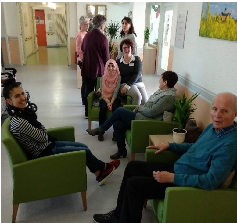
Berufe im Alten- und Pflegeheim