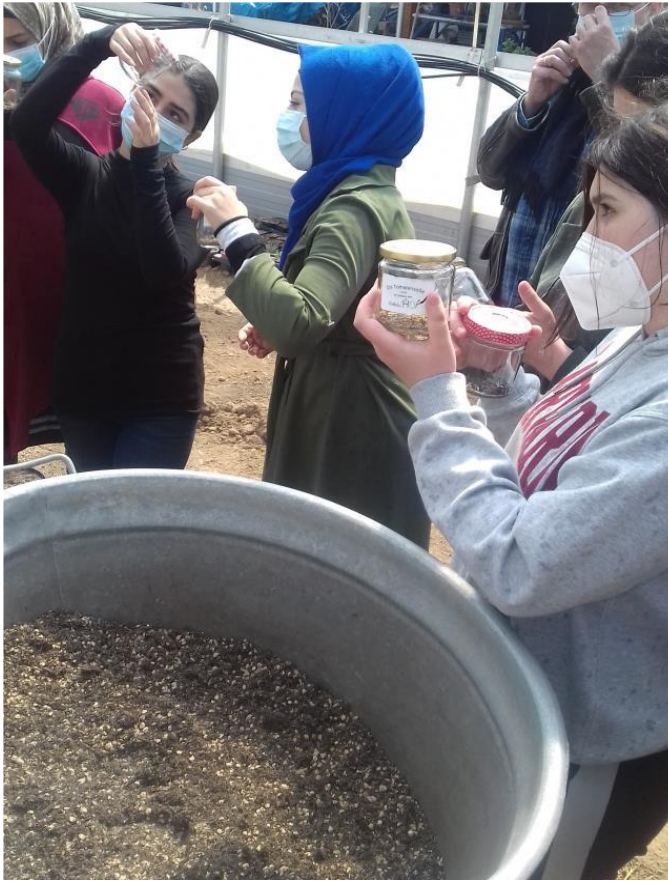
Arbeiten auf dem Bauernhof